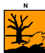
Nebezpečný pre životné prostredie

15.1.2. Názvy chemických látok uvádzaných v texte označenia obalu: hydroxid meďnatý CAS 20427-59-2