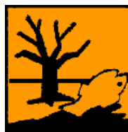
N - Nebezpečný pre životné prostredie